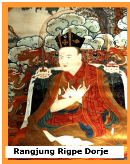
Rangjung Rigpe Dorje

Può anche succedere che l'indicazione non abbia un substrato materiale, ma che arrivi in sogno o tramite una visione. Per questo alla morte di un tulku o di un lama che abbia ottenuto in vita elevate realizzazioni, i suoi discepoli si rivolgono a maestri noti per le loro capacità extrasensoriali; questi, attraverso vari metodi divinatori, compresi i sogni e le visioni, cercano di ottenere indicazioni circa l'identità del bambino in cui il defunto si è